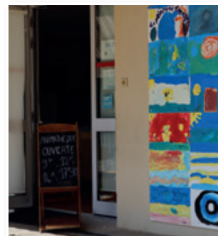
Animathèque des Pugets