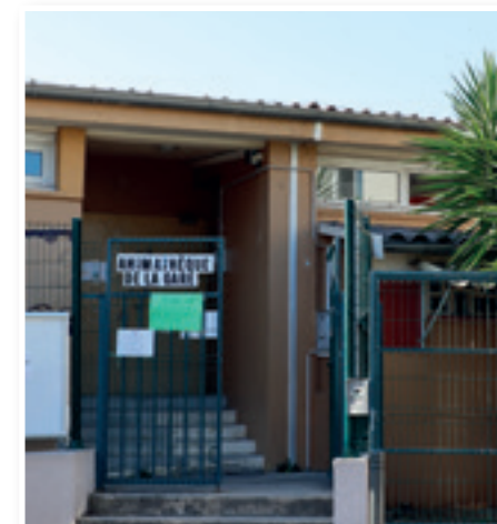
Animathèque de la Gare